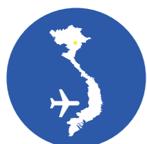
Tổ chức Tour Nội địa