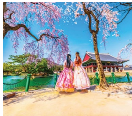
01 Tổ chức Tour du lịch trọn gói trong nước và quốc tế