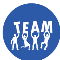
Tổ chức Hội Nghị, Hội Thảo, Team Building, Gala Diner...