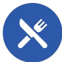
Nhà hàng ăn uống