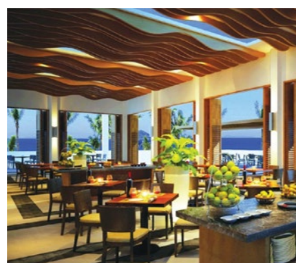
05 Nhà hàng kinh doanh, ăn uống