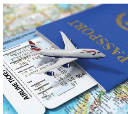
04 Đại lý vé máy bay trong nước và quốc tế