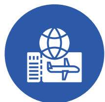
Đại lý vé máy bay Trong nước và Quốc tế