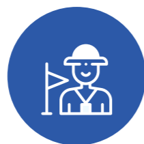
Cho Thuê Hướng dẫn viên, MC, Đạo cụ Team Building, Gala...