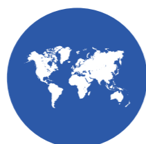
Tour cho khách nước ngoài đến Việt Nam