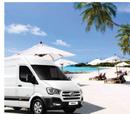
03 Cho thuê xe du lịch 4 - 45 chỗ