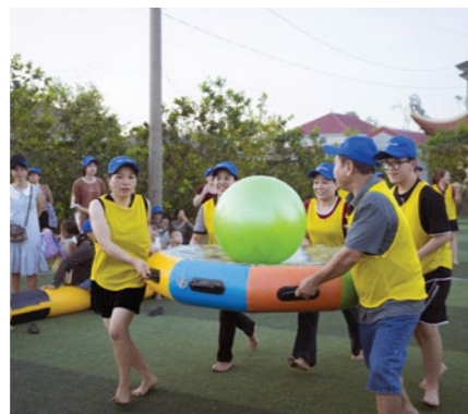
02 Tổ chức trọn gói chương trình Team building, Gala.