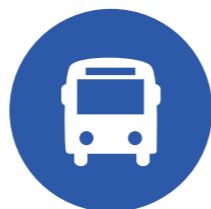
Cho thuê xe du lịch 4 - 45 chỗ