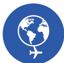
Tổ chức Tour Nước ngoài