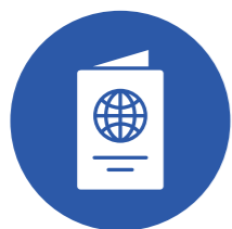
Tư vấn và hỗ trợ visa Xuất cảnh và Nhập cảnh